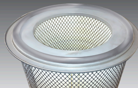
STYLE WHEELABRATOR " DROP-IN "