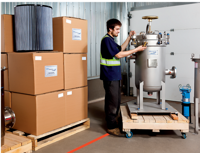
Une partie des solutions développées par Filtrindustries consiste à installer le filtre approprié. L'entreprise a un réseau inégalé de partenaires et de fournisseurs.